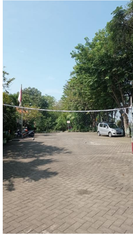
Gambar 7. Dokumentasi Lapangan UPT SDN 75 GRESIK