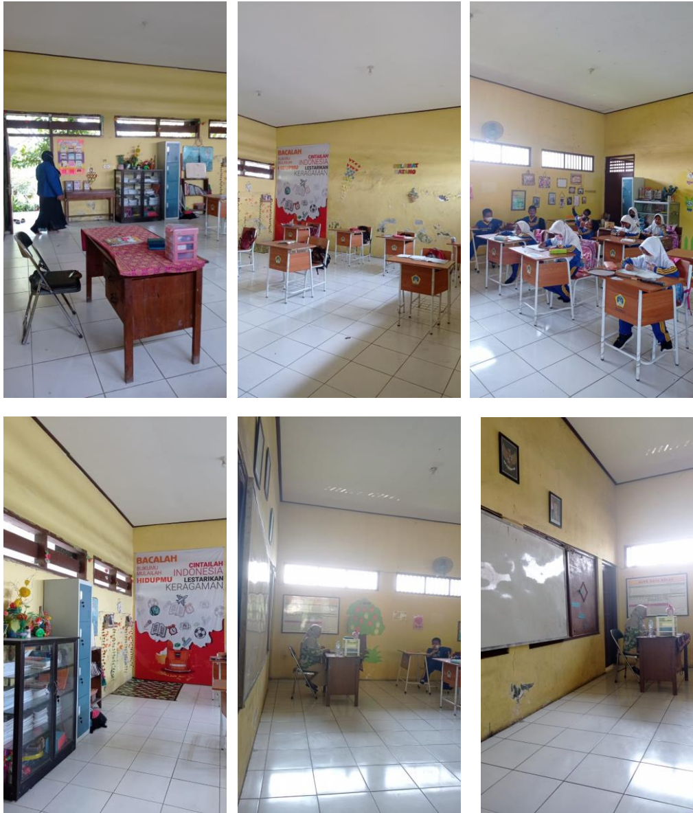
Gambar 6. Dokumentasi ruang kelas UPT SDN 75 Gresik