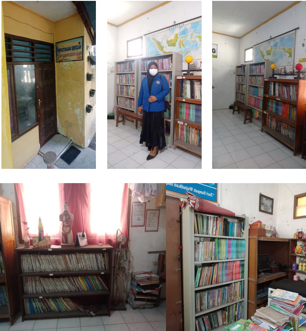
Gambar 8. Dokumentasi perustakaan UPT SDN 75 Gresik