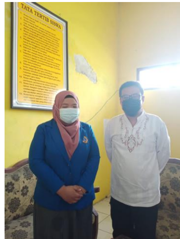
Gambar 3. Dokumentasi wawancara dengan guru UPT SDN 75 Gresik