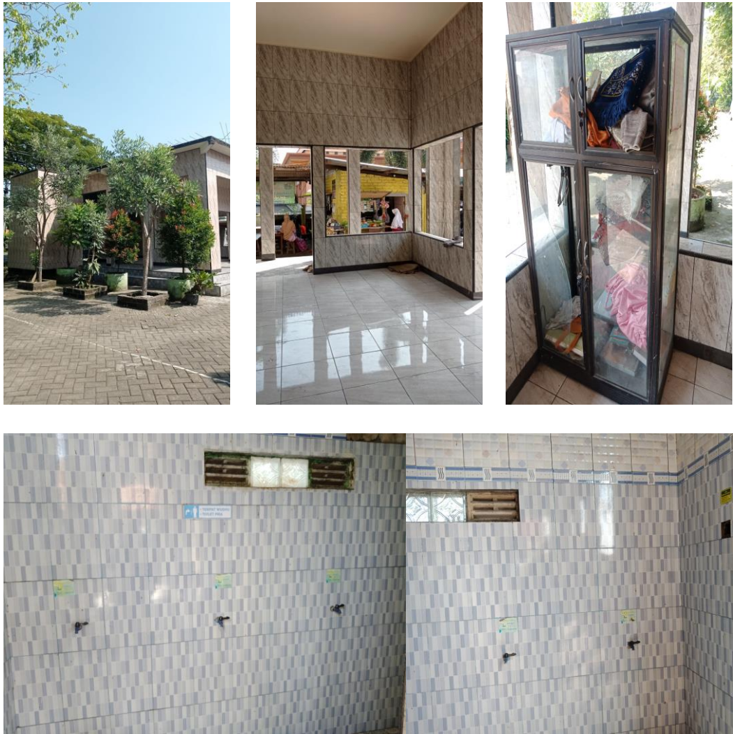
Gambar 10. Dokumentasi musholah UPT SDN 75 Gresik