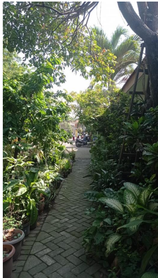
Gambar 13. Dokumentasi taman sekolah UPT SDN 75 Gresik