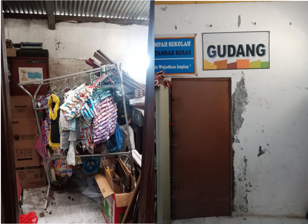
Gambar 12. Dokumentasi gudang UPT SDN 75 Gresik