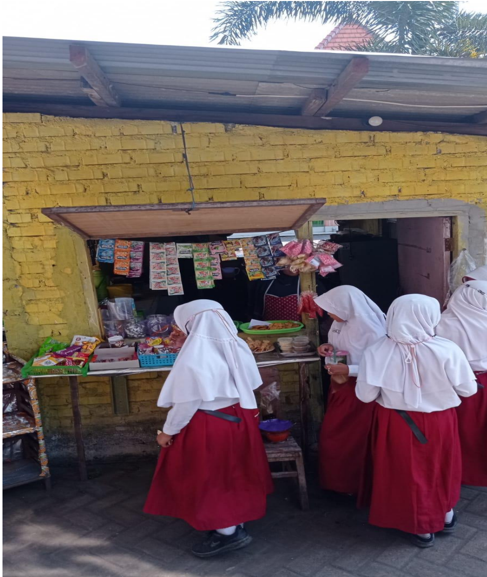
Gambar 9. Dokumentasi kantin UPT SDN 75 Gresik