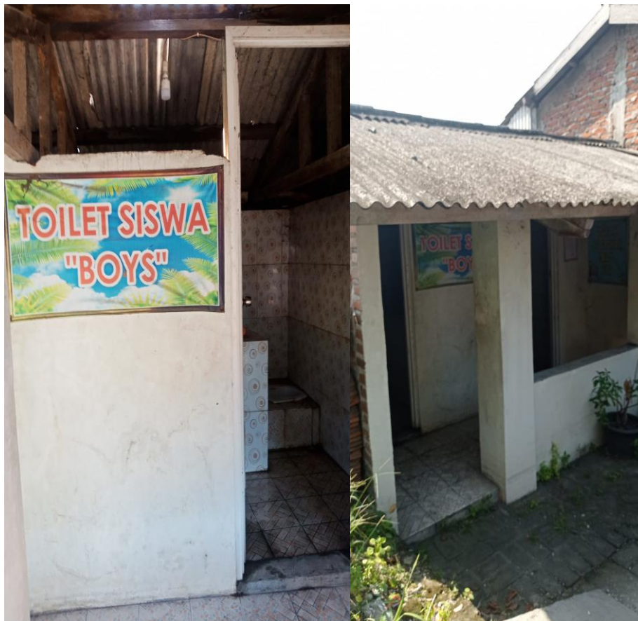
Gambar 11. Dokumentasi kamar mandi UPT SDN 75 Gresik