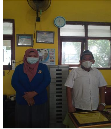
Gambar 2. Dokumentasi wawancara dengan Kepala Sekolah UPT SDN 75 Gresik