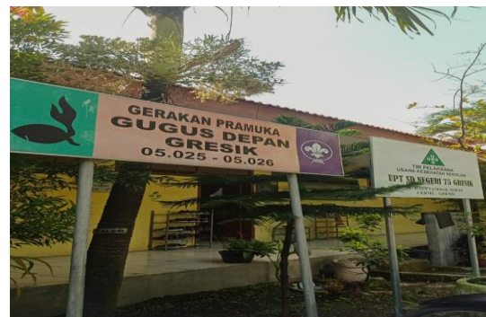
Gambar 4. Dokumentasi gedung UPT SDN 75 GRESIK