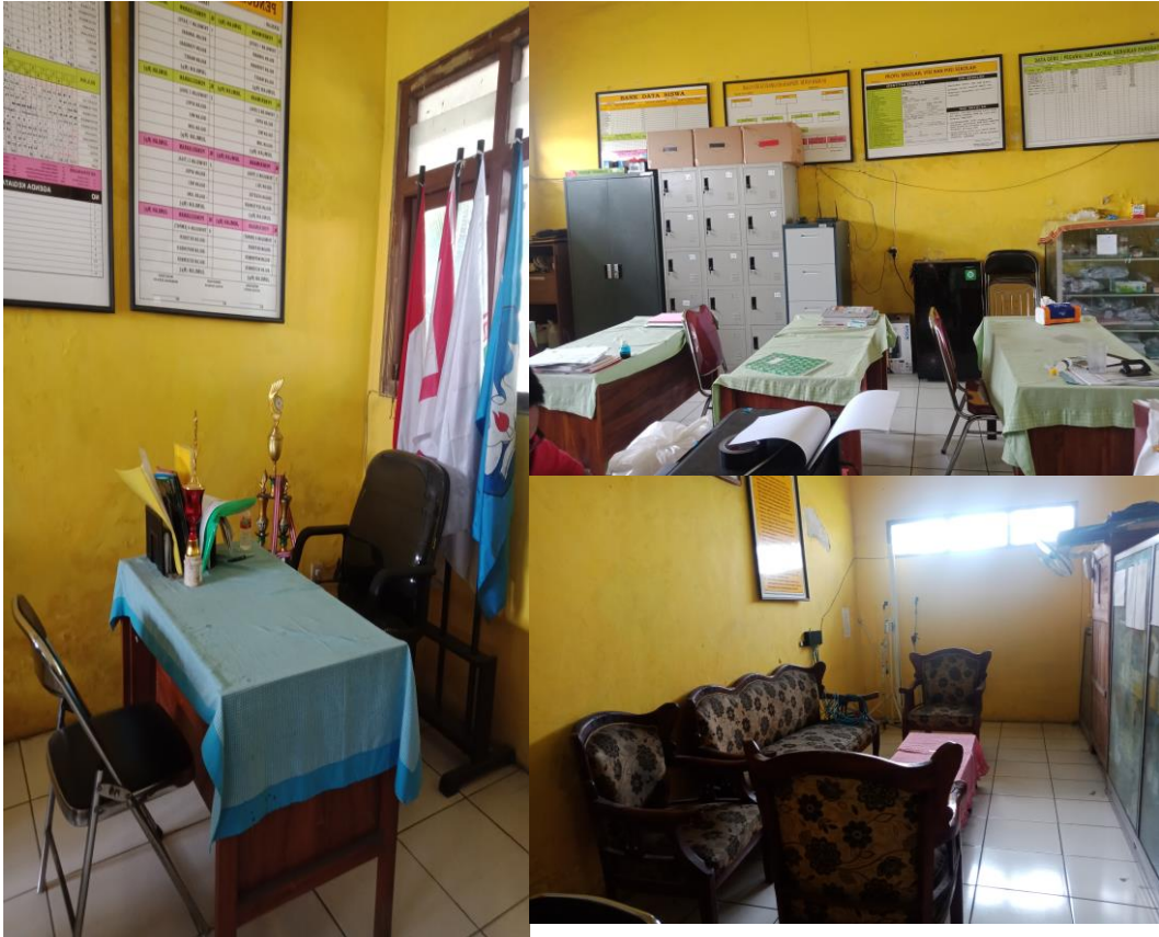
Gambar 5. Ruang kepala sekolah dan ruang guru UPT SDN 75 Gresik