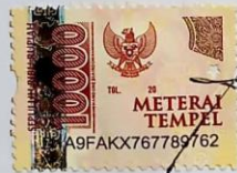
NOVELLIA CICI INDAHWATI