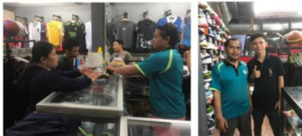
Gambar 1. Kegiatan Pengumpulan Data Peningkatan Pelayanan

Seiring berjalan waktu berdasarkan hasil observasi dan wawancara yang telah dilakukan antara tim pengabdian dengan pekerja hingga pada pemilik usaha mendapati dengan keterdapatannya pola kerja sebagai salah satu hambatan dalam memaksimalkan saran dan prasarana ini merupakan suatu komponen tambahan yang dapat disisipkan dalam pendampingan yang telah direncanakan ditemukan pula bahwa didalam kegiatan usaha tersebut didapati masih dalam proses adaptasi dengan pola kerja baru akibat dampak dari pandemi yang sangat berpengaruh dalam kegiatan usaha, temuan ini dapat dinilai sebagai keterlamabatan sikap yang diberlakukan dalam kegiatan usaha, faktor lain yang dinilai menjadi unsur kendala atas temuan ini bahwa pemberdayaan sumber daya manusia di kegiatan usaha ini tergolong sedikit. (Avandia Yovan Ari Krisma et al., 2023)