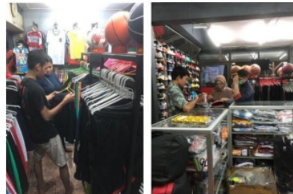
Gambar 3. Kegiatan Pendampingan Pemenuhan Informasi Produk

Kegiatan ini dapat dikategorikan berjalan lancar dengan dukungan pemilik usaha dalam mengadakan media elektronik yang mumpuni untuk dijadikan media pemasaran online, serta dibukanya lowongan kerja di usaha tersebut untuk mendukung keterjamahnya kegiatan usaha yang memerlukan tambahan sumber daya manusia. Pada sesi praktek memaksimalan pelayanan media sosial dan aplikasi e-commers dengan pendampingan secara langsung untuk membantu kinerja dan hasil kinerja usaha memiliki hasil ketercapaian minat beli ulang yang hasilnya digolongkan sangat baik. Evaluasi dalam kegiatan ini yang diketahui melalui metode wawancara dan pengisian survei kuisioner dimana responden merupakan konsumen dengan beberapa poin kategoridimana salah satu diantaranya adalah berdasarkan pembelian ulang. (Arasy, 2015)