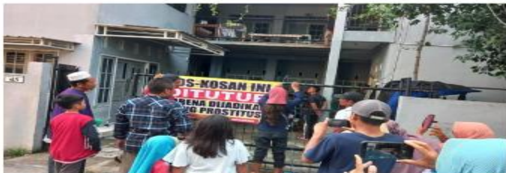
PT. Abadi Metal Utama, kos-kosan warga RT 09 RW 07 Desa Randuagung melandak karena diduga sebagai tempat prostitusi. Foto yang diambil di Desa Perintis, Kecamatan Kebomas, Kabupaten Gresik, Kamis (1/6/23). Desa Randuagung, Kecamatan Kambali yang diduga dijadikan tempat prostitusi.