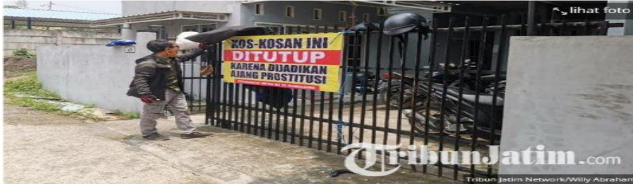
Sebuah rumah kos pria di Desa Randuagung, Gresik, Jawa Timur, ditutup warga, karena diduga menjadi tempat prostitusi, Rabu (22/3/2023).

Penulis: Willy Abraham | Editor: Dwi Prastika