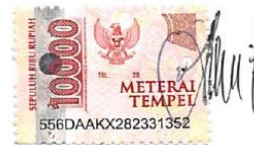
CATUR APRIL NUGROHO