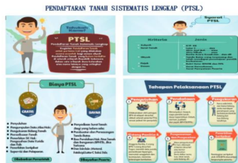
Gambar 1 Materi Pendaftaran Tanah Sistematis Lengkap (PTSL)

Sertifikasi tanah di Desa Jrebeng, Kecamatan Dukun, Kabupaten Gresik, Indonesia, ditangani dalam beberapa cara, antara lain: 1) Ceramah dan tutorial digunakan dalam kegiatan pelatihan dan pendampingan sebagai metode pengajaran. Konten gaya kuliah disediakan oleh tim implementasi layanan, yang mengandalkan tanya jawab dan tutorial. Teknik diskusi kelompok kecil adalah pendekatan pengajaran yang membagi siswa menjadi beberapa kelompok berdasarkan percakapan kelompok kecil. Setiap sesi dipecah menjadi kelompok yang terdiri dari tiga sampai lima orang (Fatimah, S., et al., 2012). Mereka bekerja sama untuk menyelesaikan masalah atau memenuhi persyaratan pendaftaran